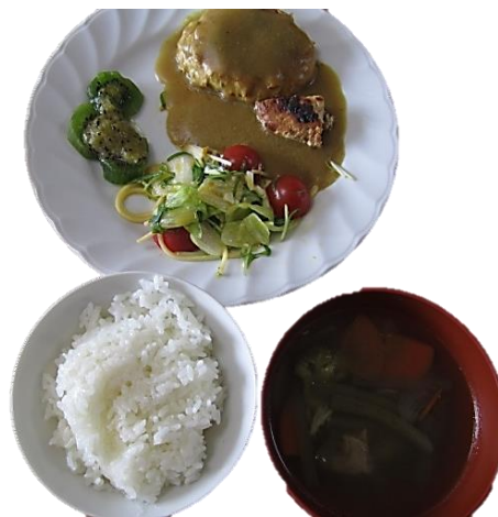
どんぐり農園で収穫した「ヤーコン」入り豆腐ハンバーグ定食

食事は、小型家電のリサイクルやふきんに刺繍をする手工芸品制作など、他の作業をしていたメンバーとももちろん一緒にします。いただく人は作ってくれた人に感謝をし、作った人は「美味しい」と言ってもらって嬉しくなる、互いを思いやるプログラムでもあると考えています。