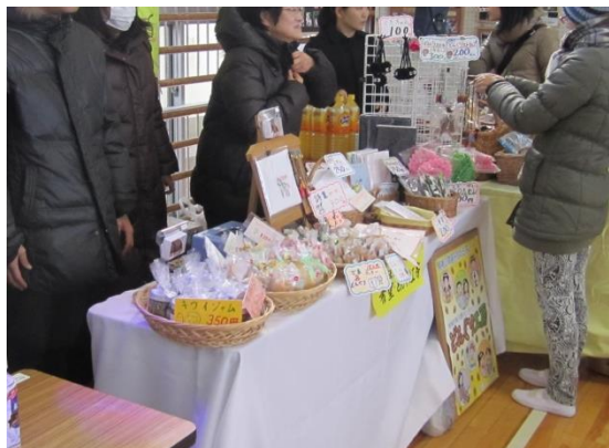
小学生が「売り子さん」として来てくれました