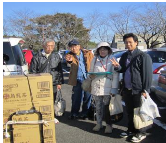
(第 4 ブロック交流会にて)