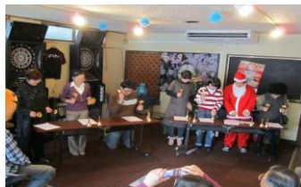
(クリスマス会にて)